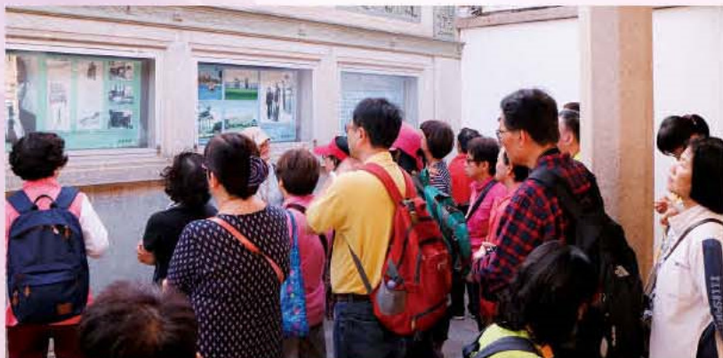
團友們觀看陳嘉庚先生事蹟