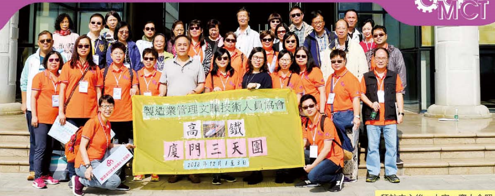
拜訪中心後，大家一齊大合照