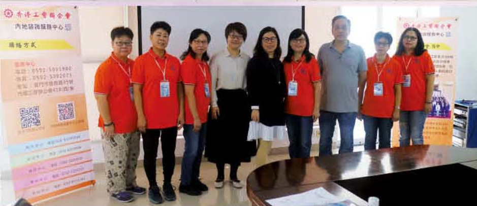
福建中心同事和理事們合照