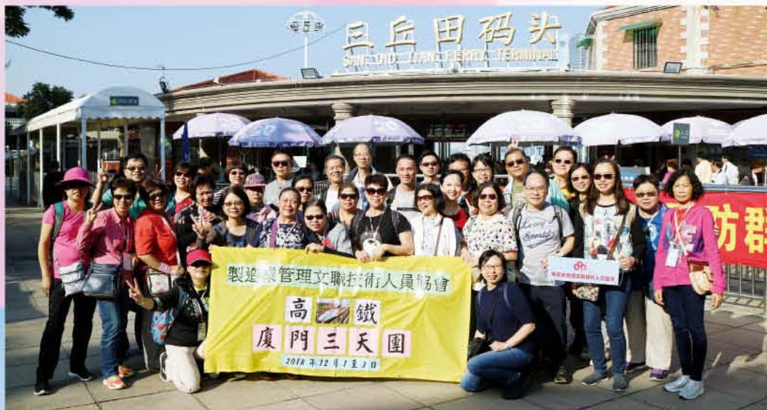
踏上鼓浪嶼，開心大合照