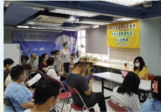
主席匯報一年的會務報告

第十三屆第二次會員代表會議6日在會所召開，代表們通過會務及財政報告，更就會務的發展進行了討論，氣氛熱烈。