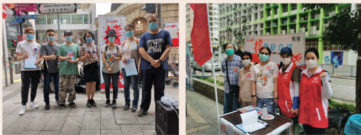
本會義工參與不同地方的街站簽名工作

工聯會在全港設置街站，廣大市民紛紛來到街站簽名支持立法。經過一年的社會動亂，失業率攀升，經濟嚴重衰退，市民飽受「暴力攪炒」之苦，簽名表達對止暴制亂，恢復社會秩序，保持繁榮穩定、安居樂業的期盼！街站義工更被惡意滋擾，但無損義工朋友的愛國愛港的心，他們身體力行，用實際行動來表達捍衛家國的決心。