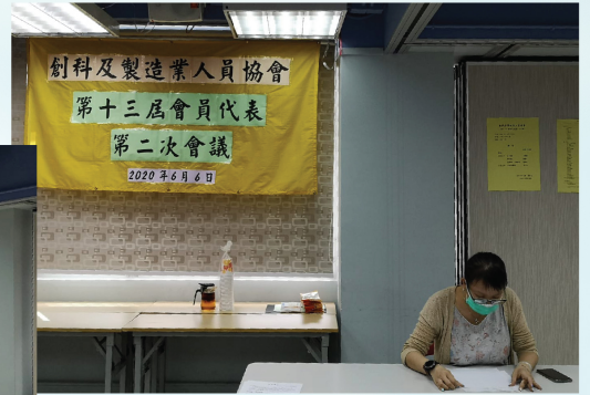
代表會司庫報告財務報表