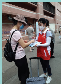
李小姐於街站簽名活動中

《國歌法》立法意義重大，透過指引性條文讓市民尊重國歌，並就一些公開及故意侮辱國歌或不當使用國歌的行為訂立罰則。立法不但維護了國家尊嚴，亦能讓香港市民更清楚了解國家歷史和國歌的精神內涵。